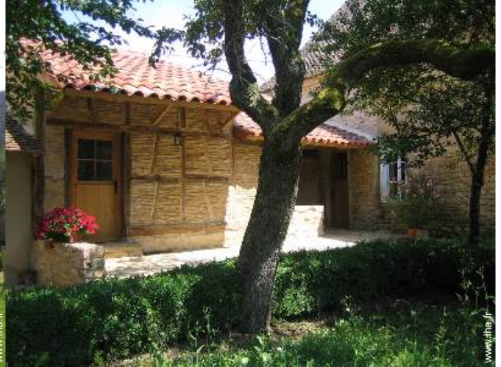
Maison de Charme