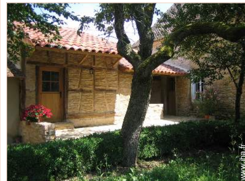
Maison de Charme