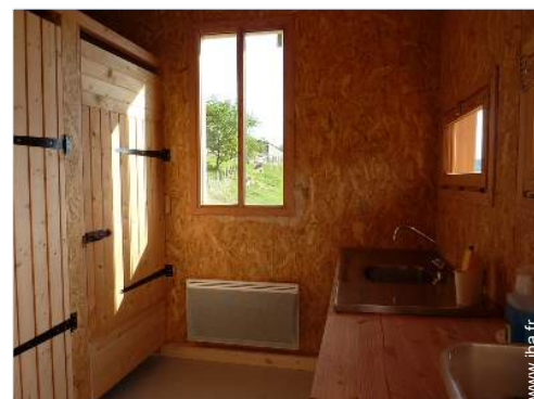
Confort intérieur et équipements