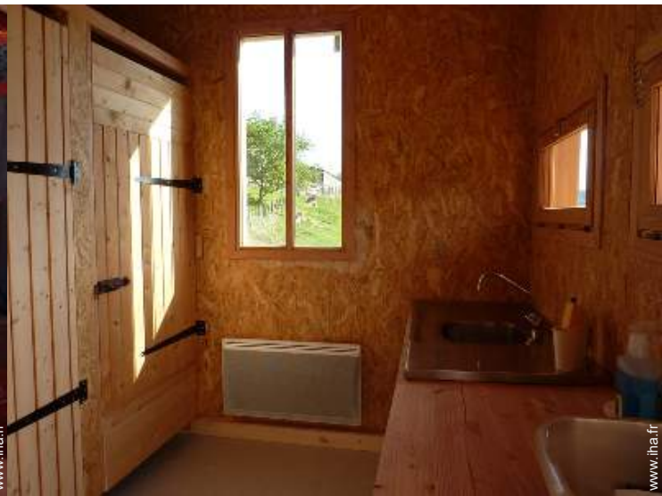
Confort intérieur et équipements