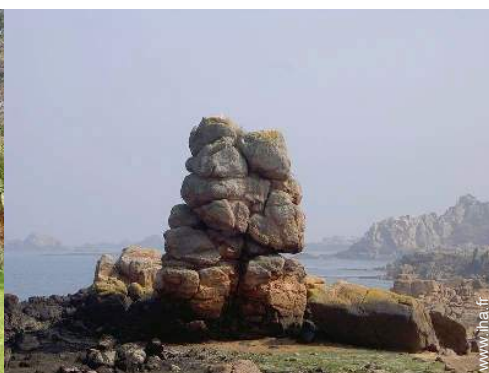
Attraites et détente