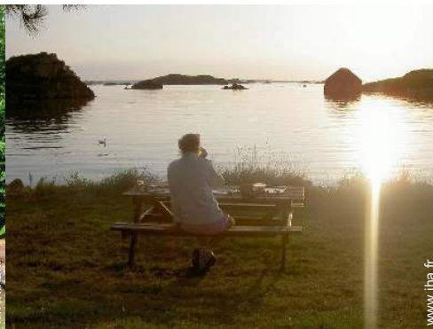
Attraits et détente