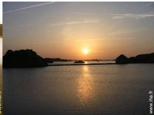
vue sur coucher de soleil