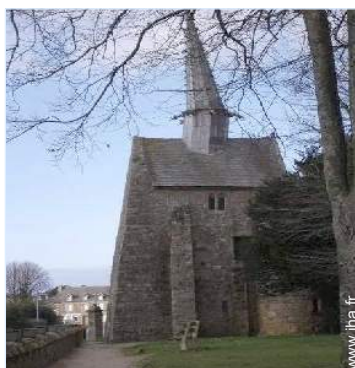
vue sur village