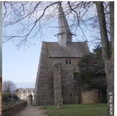
vue sur village