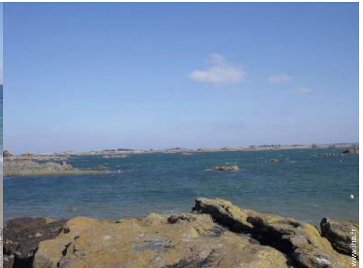
plage de rocher