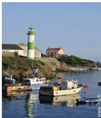
port de plaisance