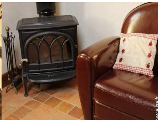
poêle à bois