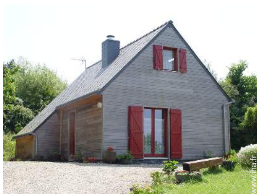
Maison en Bois