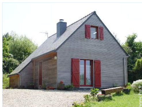
Maison en Bois