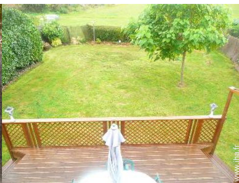
vue depuis la mezzanine