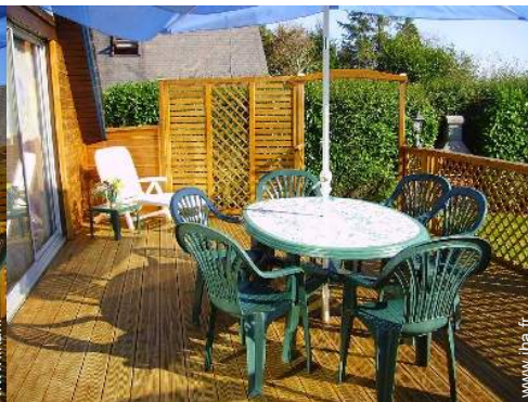
salon de jardin