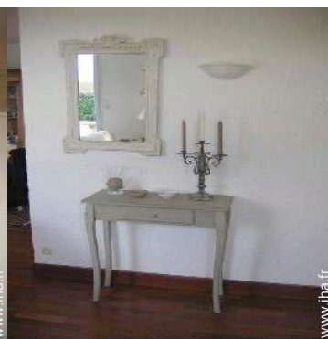
vue depuis le salon