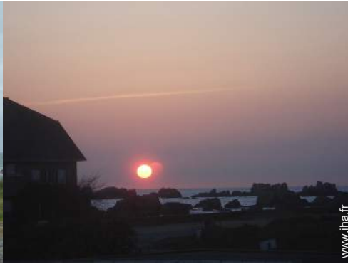
vue sur coucher de soleil