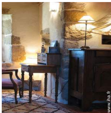
salon de musique