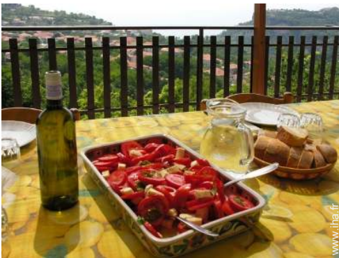
préparation repas local