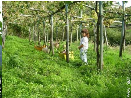
vue sur champs agricoles