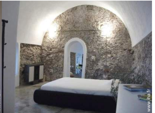
Couchage - lit(s)