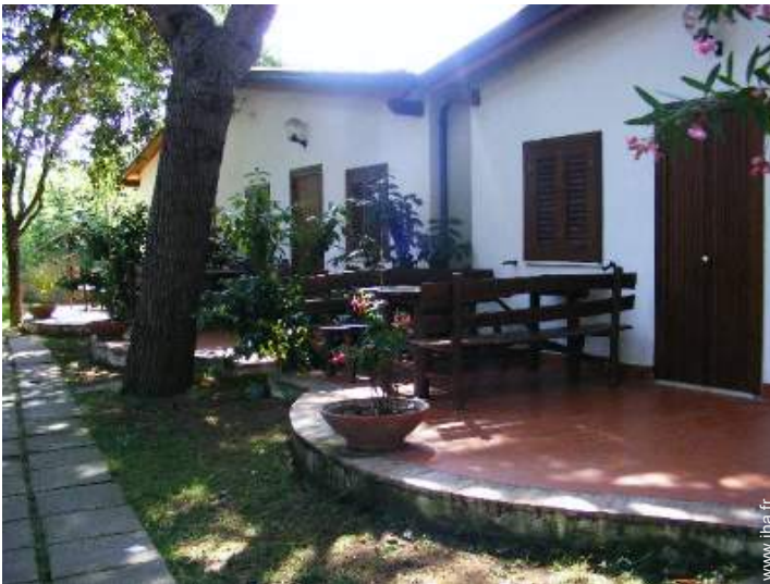
Maison de Village