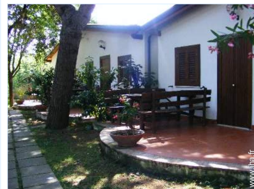
Maison de Village