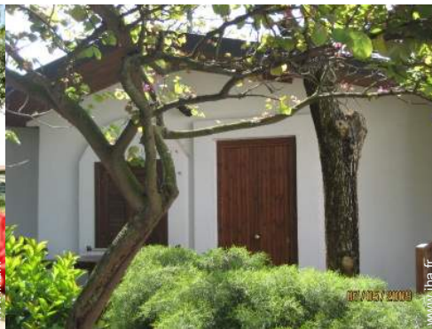
Maison de Village