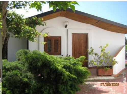
Maison de Village