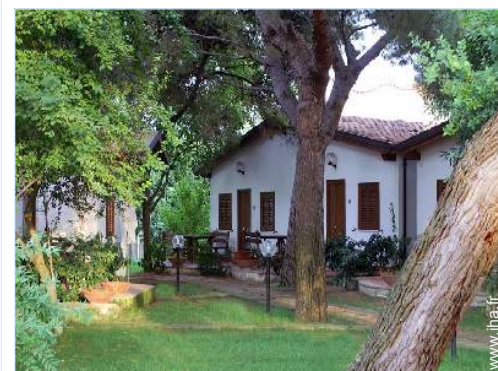
Maison de Village