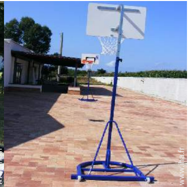
panier de basket