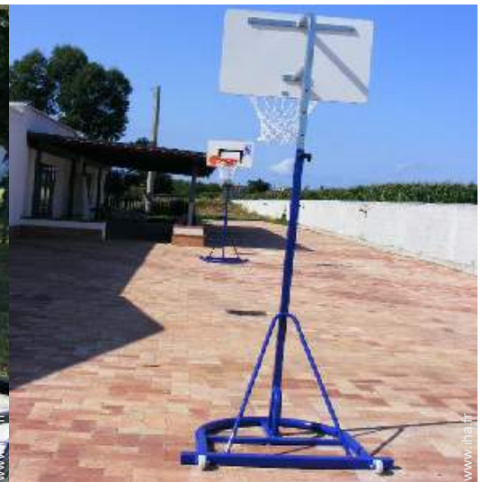
panier de basket