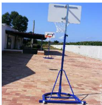
panier de basket