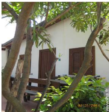
Maison de Village