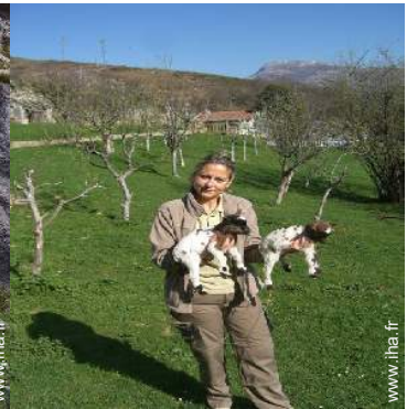
animaux de ferme