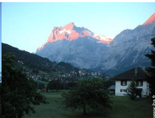
vue depuis la terrasse couverte