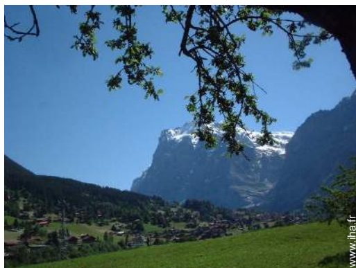
vue depuis la véranda