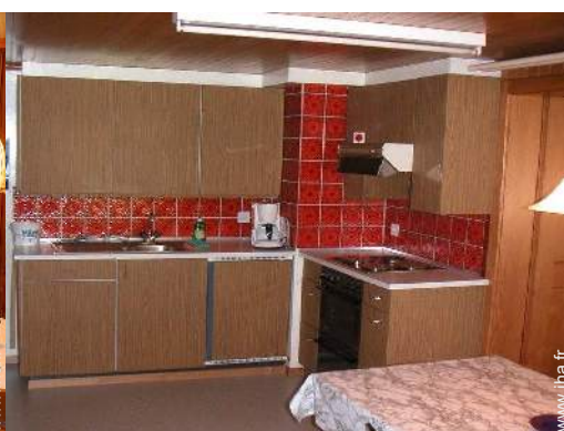
grande cuisine indépendante