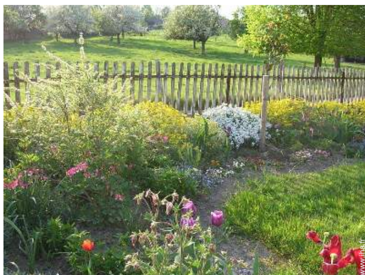
vue sur prairie