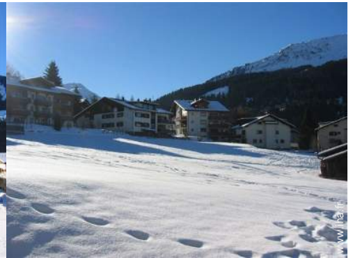
vue sur prairie