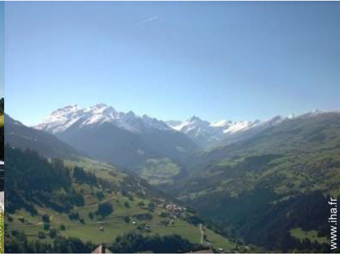
vue sur montagne