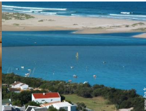
planche à voile