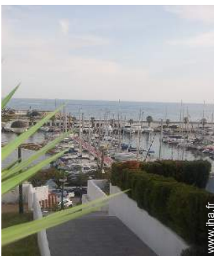
vue sur port