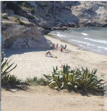
plage de naturisme