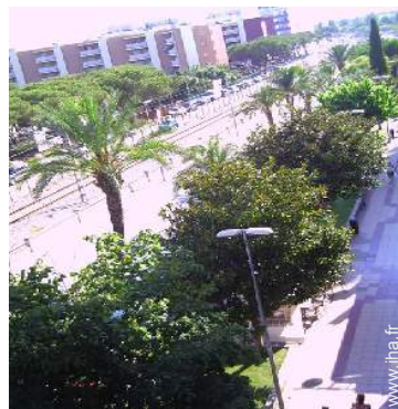
vue sur rue/avenue