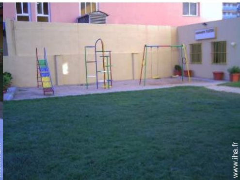
bac à sable