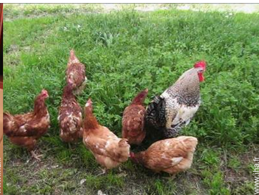
Les animaux de la maison