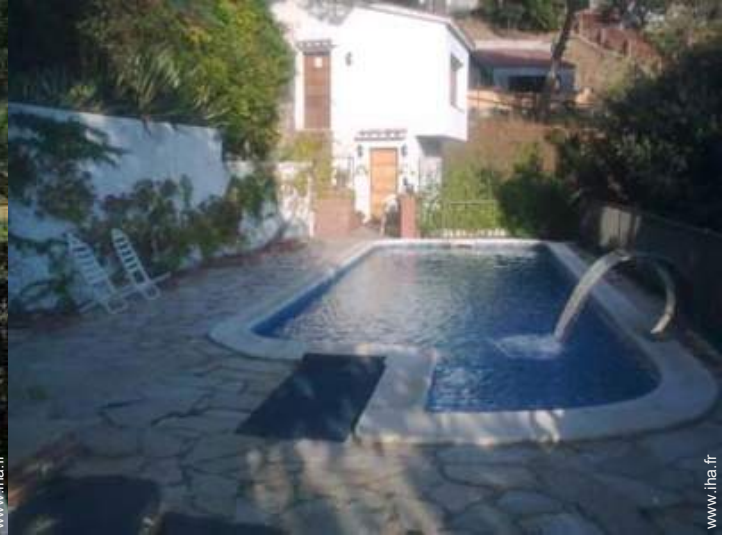
Piscine d'eau de mer