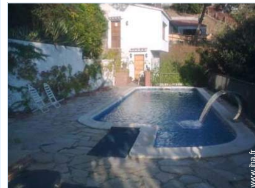
Piscine d'eau de mer