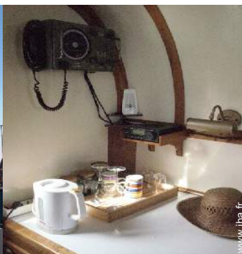
Confort intérieur à disposition des hôtes