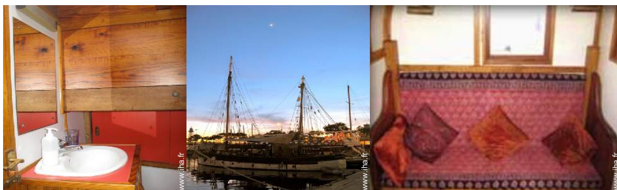
Agencement intérieur à disposition des hôtes