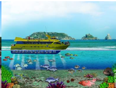
loisirs nautiques à proximité