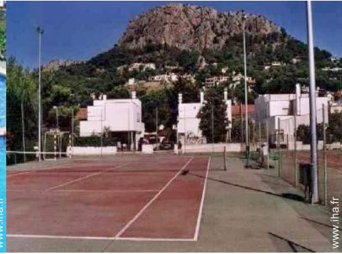
tennis dans la résidence