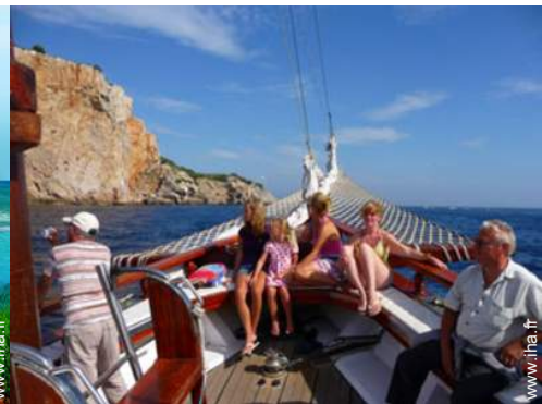
loisirs nautiques à proximité