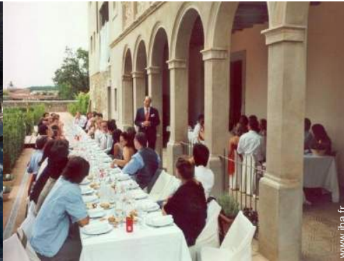
vue sur campagne