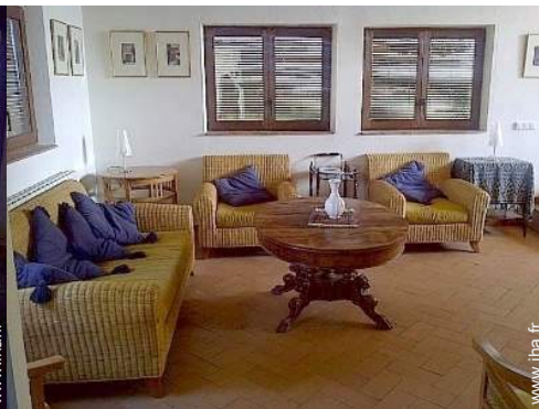
Agencement intérieur à disposition des hôtes