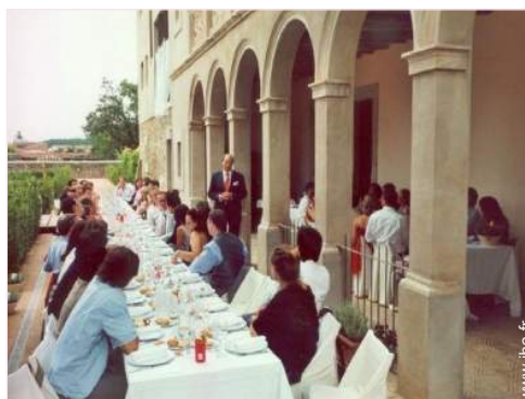
vue sur campagne

Aménagements pour handicap : auditif, mental