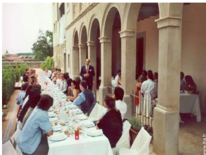
vue sur campagne