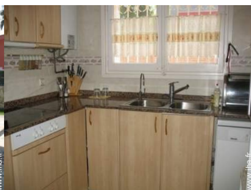
plaques de cuisson