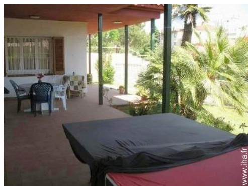
chaise(s) de jardin