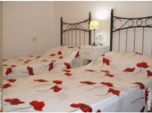
lits jumeaux simple