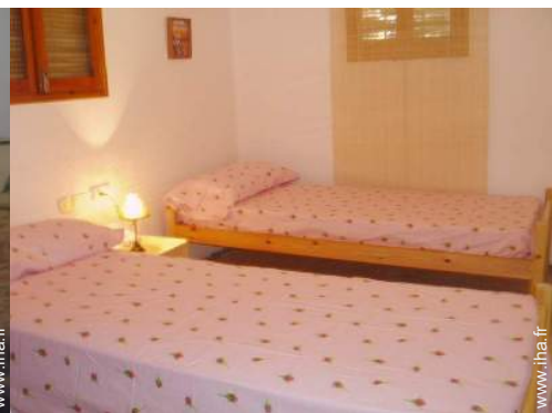
lits jumeaux simple