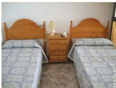
lits jumeaux simple