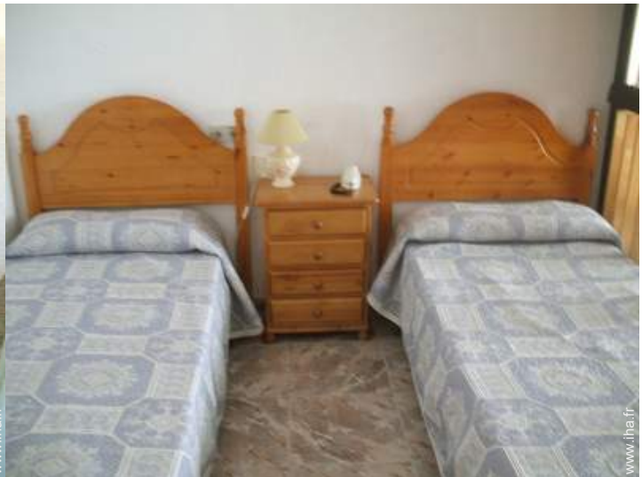
lits jumeaux simple