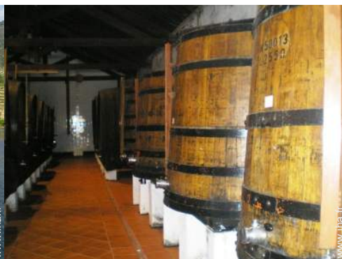
cave et dégustation de vin