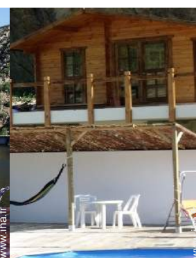
table(s) de jardin