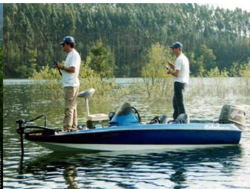
pêche à la ligne