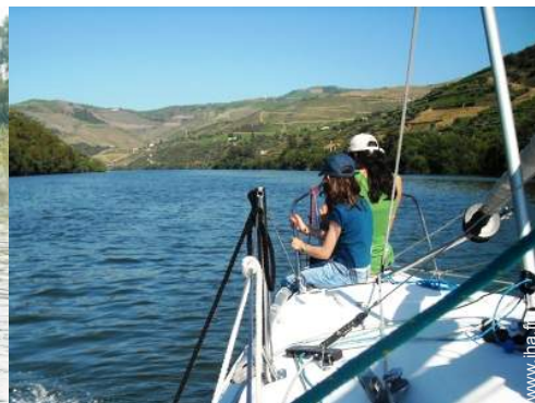
excursion en bateau