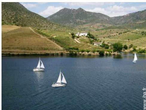
location de bateau