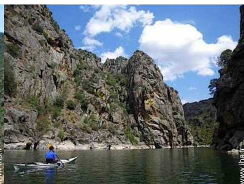
bateau avec rames