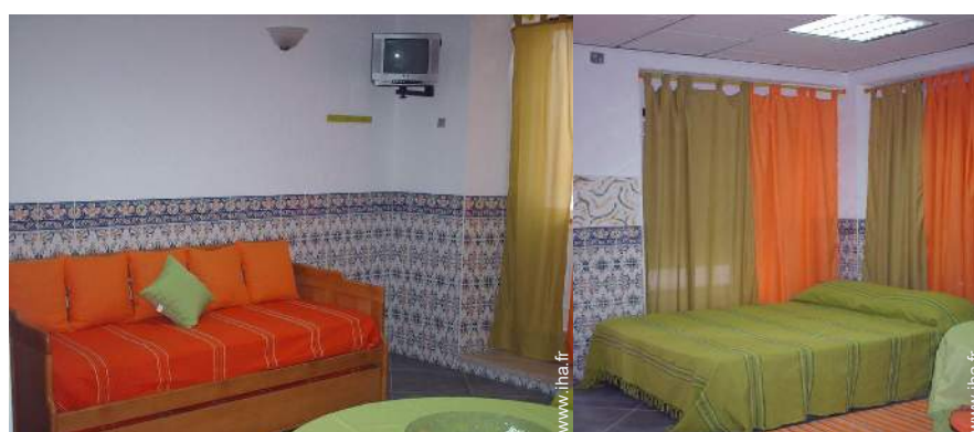
lit tiroir 1 pers