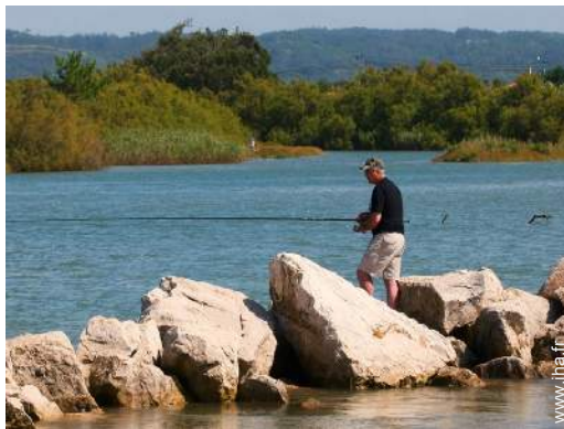
pêche à la ligne