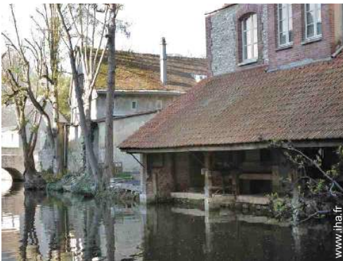
Villes à proximité