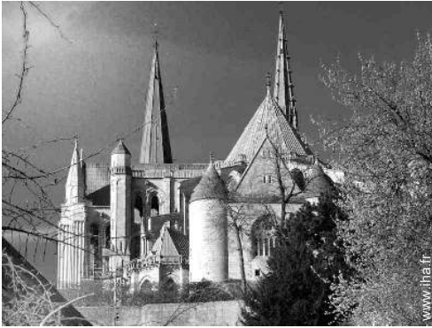
Villes à proximité