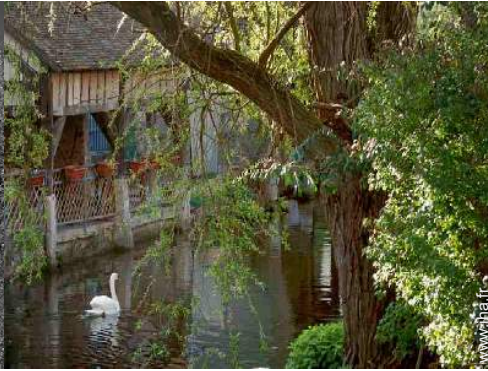
Villes à proximité