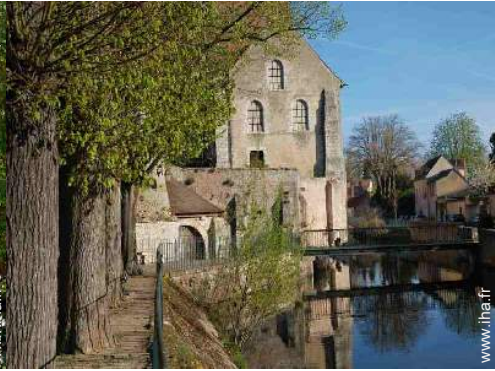
Villes à proximité