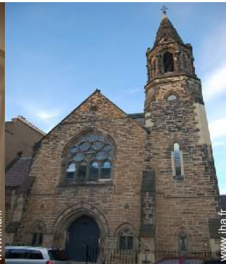
Ancienne Chapelle de Charme