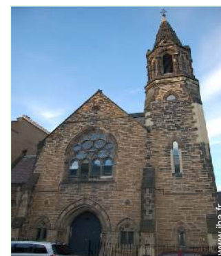
Ancienne Chapelle de Charme