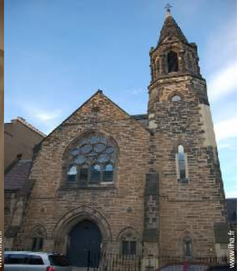
Ancienne Chapelle de Charme