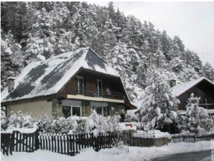
Chalet de Montagne