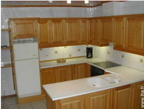
grande cuisine indépendante