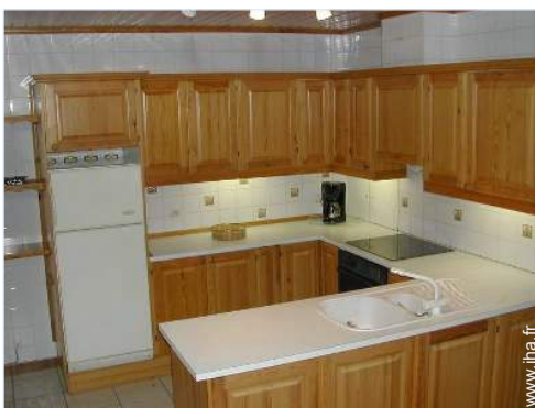
grande cuisine indépendante