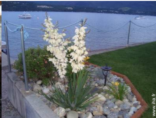
vue sur lac