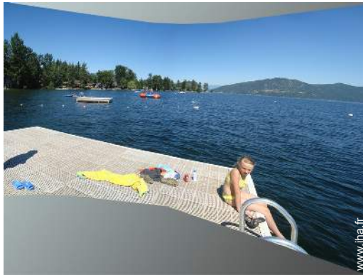
vue sur lac