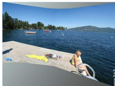
vue sur lac