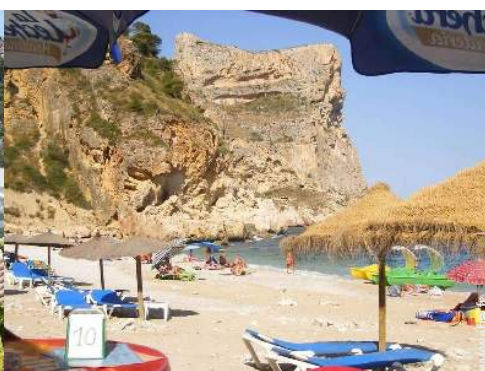
plage de rocher