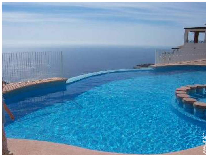
Piscine à débordement