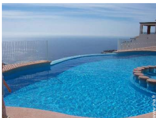
Piscine à débordement