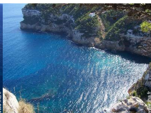
plage de rocher