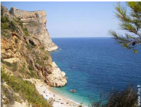
plage de rocher