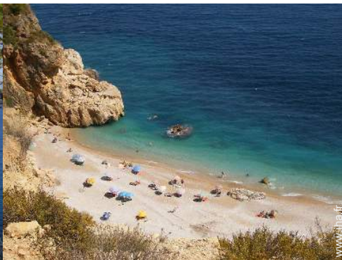
plage de rocher