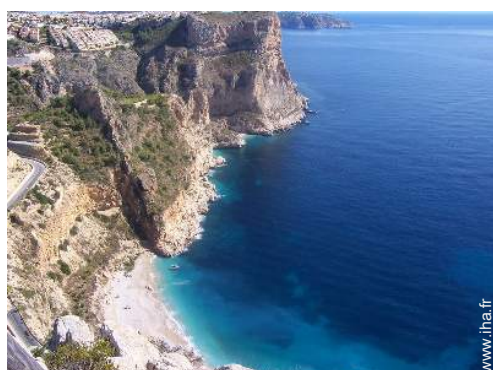
plage de rocher