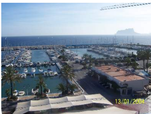
loisirs nautiques à proximité