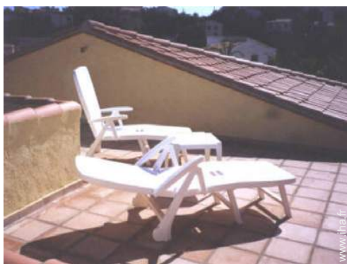
vue depuis la terrasse sur toit