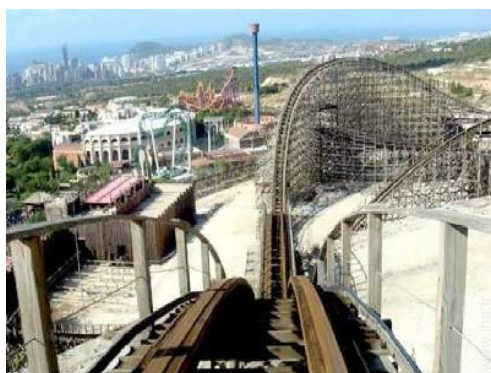
parc de loisirs