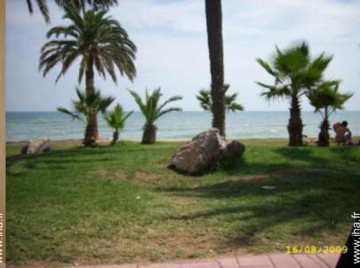
parc et jardin