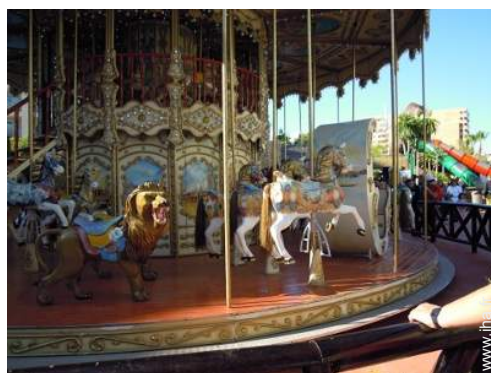
Attraites et détente