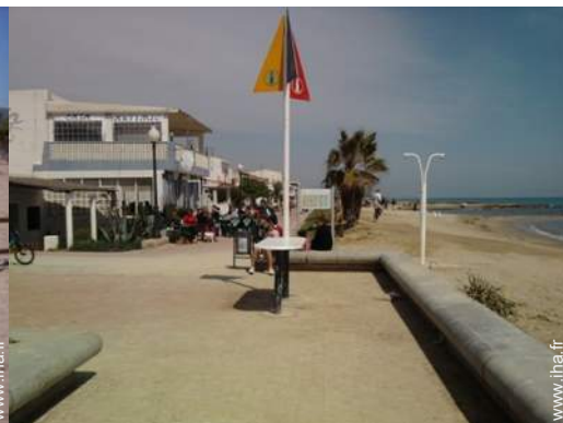
loisirs d'été à proximité