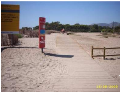
loisirs d'été à proximité