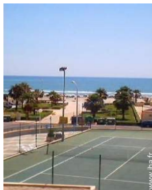
tennis dans la résidence