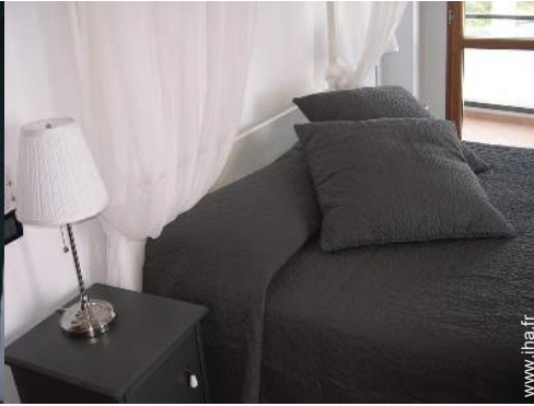
lit(s) double(s) à baldaquin