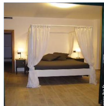
lit(s) double(s) à baldaquin

Salon d'été, barbecue, table(s) de jardin, chaise(s) de jardin, tonnelle, salon de jardin, chaise(s) longue(s), transat(s)