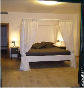
lit(s) double(s) à baldaquin