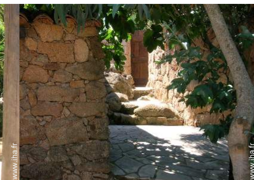
Maison de Charme en Pierre