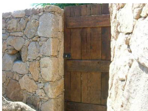
Propriété de Prestige