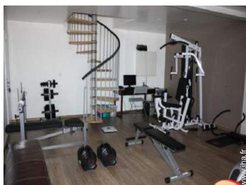
machine(s) de musculation