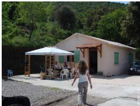
Maison de Campagne