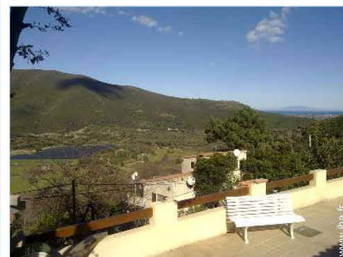
vue sur lac