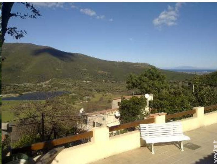
vue sur lac