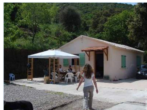
Maison de Campagne