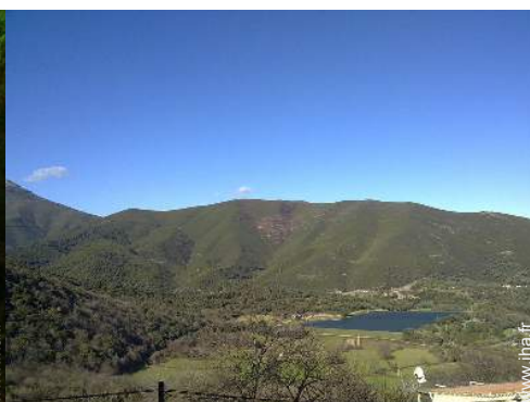
vue sur lac