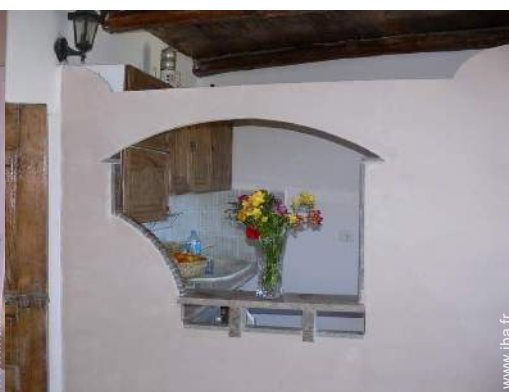
grande cuisine américaine