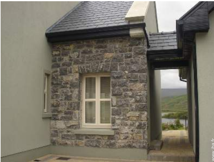
Appartement de Prestige