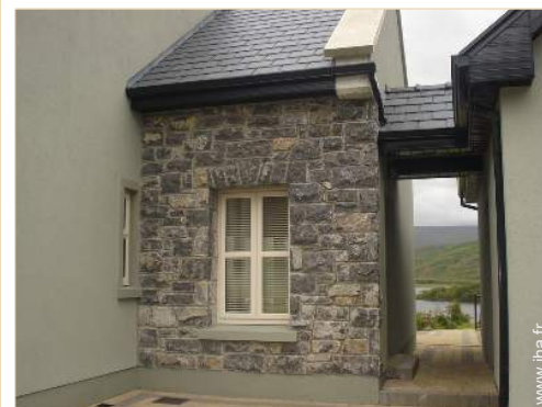
Appartement de Prestige