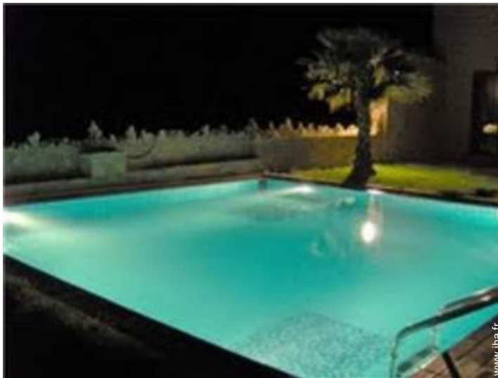
Piscine à débordement