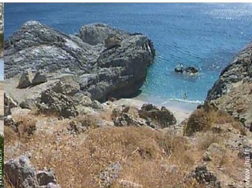
plage de rocher