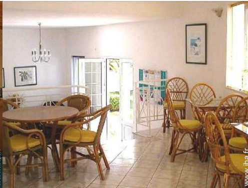
Agencement intérieur à disposition des hôtes