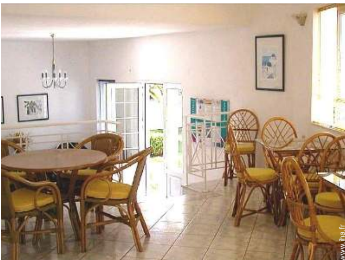
Agencement intérieur à disposition des hôtes