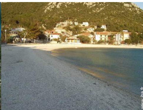
plage de galets